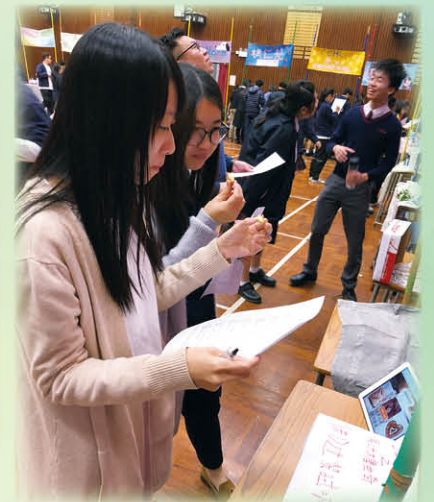
老師評判細心品嚐手工餅乾