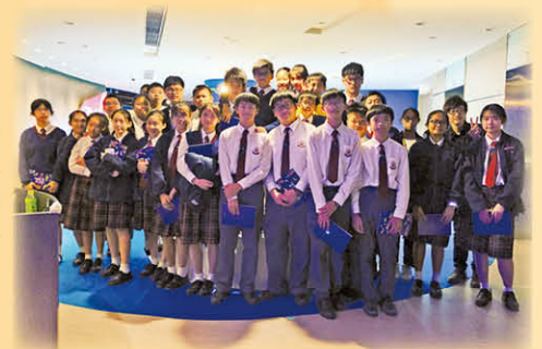
參觀香港城市大學《動物大觀園》