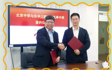
本校與北京中學結成姊妹學校