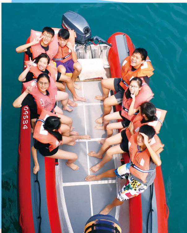
領袖訓練活動「乘風航」