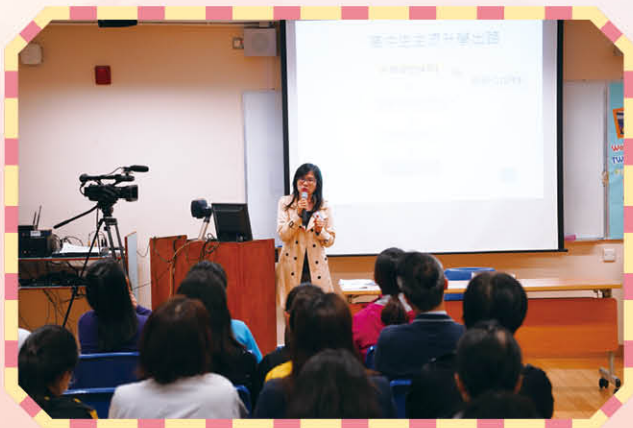
中三選科家長講座