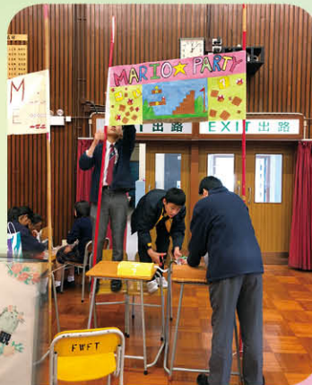
齊心協力預備攤位