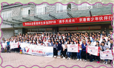
出席國家經濟發展講座