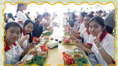
在北京中學與當地學生一同午膳