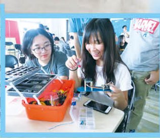
在清華大學上 STEM 課