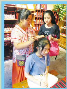
陳同學感受中國髮髻藝術