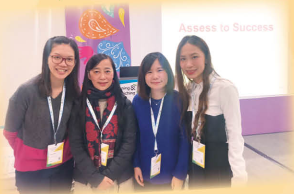
林翠翠老師與組員於特殊教育需要研討會分享