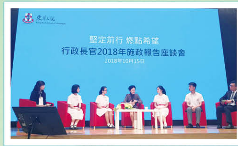
本校學生於台上就施政報告與特首交流意見