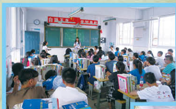
梁同學向開封五中學生授予經濟科知識