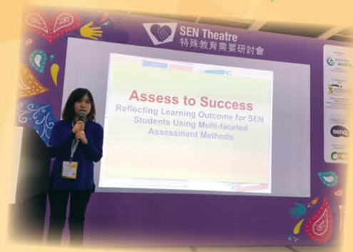
分享題目：沒有分數的評估 -- 多角度反映特教生學習成果