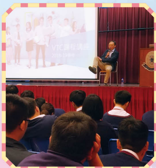
職業訓練局升學講座