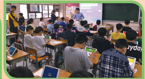
數學科體驗課堂，小學生嘗試用平板電腦學習數學，利用資訊科技進行師生互動