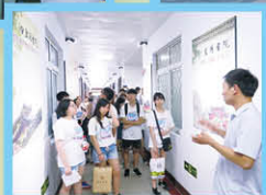
參觀開封五中歷史長廊