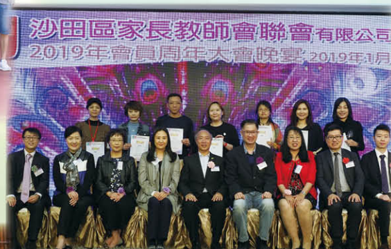
沙田區家長教師會聯會