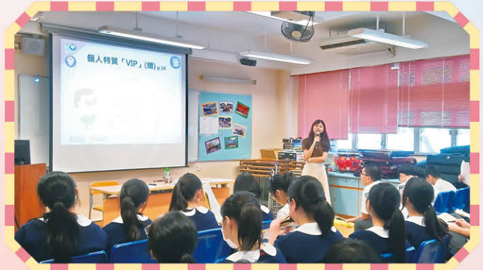
初中 My Way 生涯規劃計劃