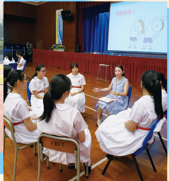
輔導員訓練及工作坊