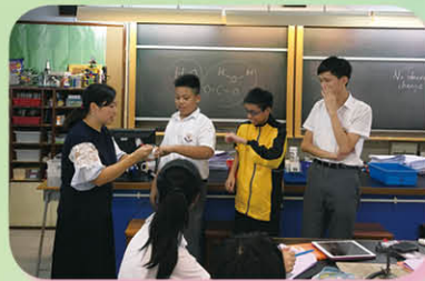
在化學課進行蘇打粉、發粉和酵母的探究