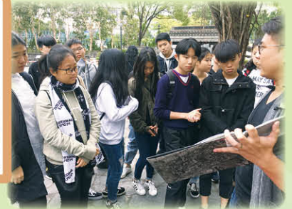
導賞員向同學介紹「九龍城寨」歷史