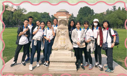
清華大學歷史最悠久標誌