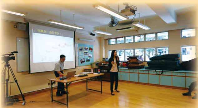
由本校教育心理學家分享「如何支援特殊學習需要的學生」的心得