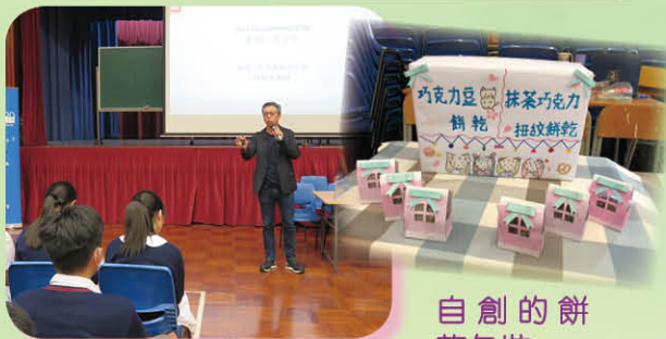
初創企業家分享創業之路