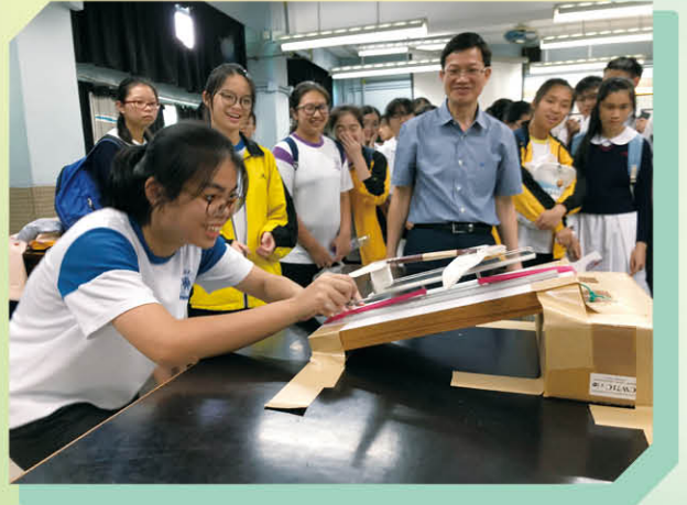
迪士尼物理世界之旅