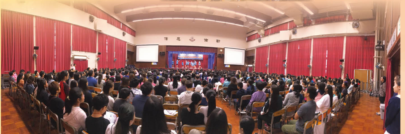
本校升中講座座無虛席，參與的家長及小學生總數接近1000人