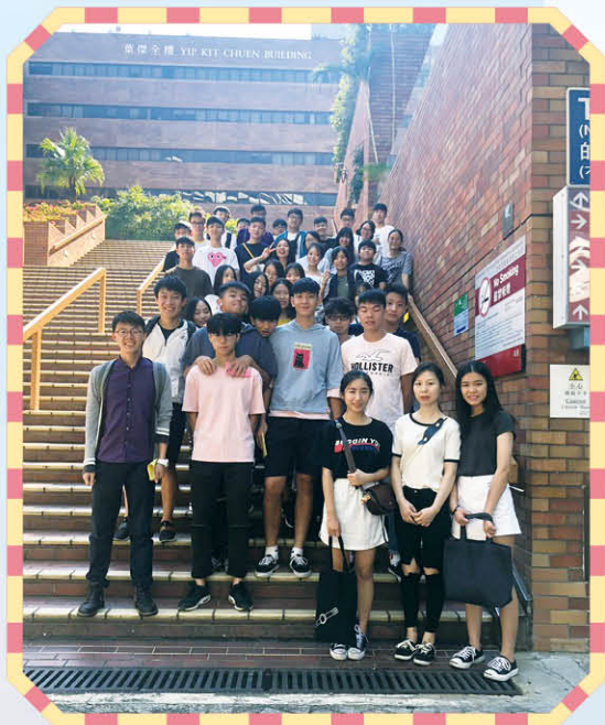
出席香港理工大學資訊日