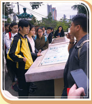
侯王古廟外認識香港歷史