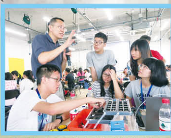
清華大學教授指導學生