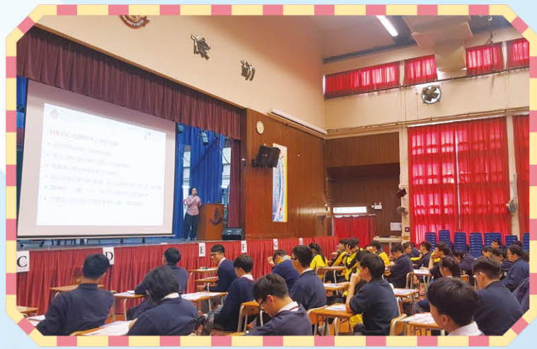
香港理工大學專上學院講座