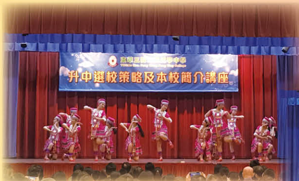
本校中國舞隊在校際舞蹈節屢獲獎項，在去屆舞蹈節更獲優等獎的傑出成績