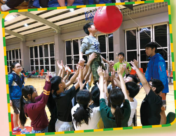
透過團體活動提升自信心