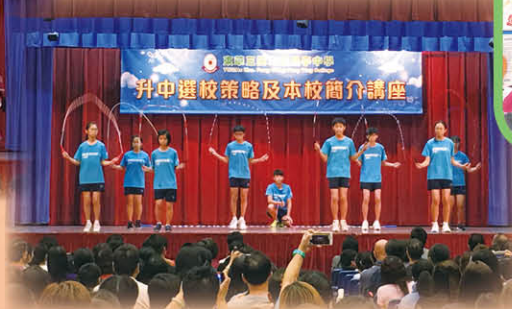
本校花式跳繩隊為在場家長表演，好評如潮