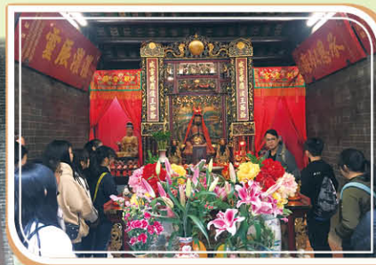
同學參觀侯王古廟內的神龕