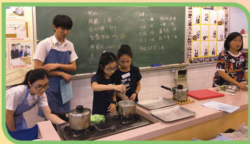
家政科生活體驗，小學生參與製作檸檬酪，一嚐親手製作甜品的樂趣