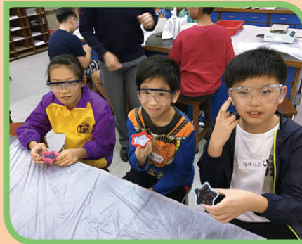
化學實驗課堂體驗，同學運用化學知識自家製作肥皂，既環保又有趣