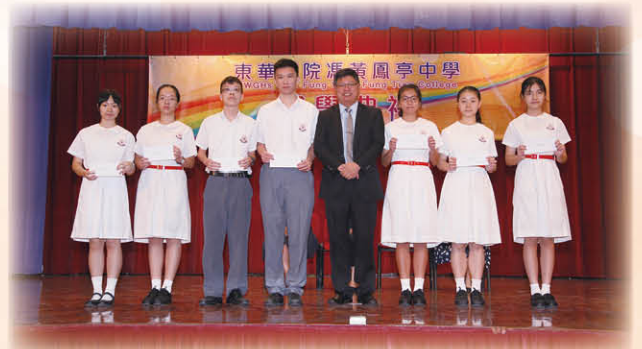
校長頒發獎學金予表現優異的同學

教學方面除了持續推行 STEAM 和電子學習外，亦積極進行本科或跨課題專題研習，培養學生共通能力，促進學生參與學習活動及照顧學習多樣性。其中中三級的「我的招牌餅乾」研習聯同多個學科讓學生體驗從設計、試驗、製作、宣傳各階段，學習如何建立自家品牌，全校師生亦踴躍參與展覽會，場面相當熱鬧。同時十分感謝馮氏捐款設立 STEM 及 CODING 教室，為學校提供更好的設備予學生作不同的專題研習。