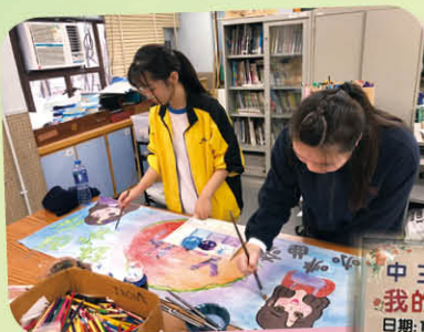
在視藝課悉心製作餅店橫額