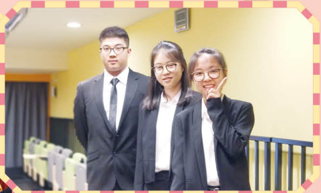
出席東華聯校英語面試技巧講座