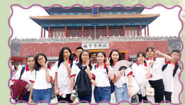
依依不捨地離開故宮

2018年9月10日是本校與內地北京中學的大日子，當天本校正式與北京中學結盟成為姊妹學校，為提升教育素質、促進兩地文化交流踏出一大步。