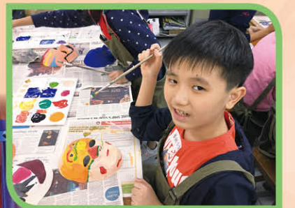
視覺藝術科課堂體驗，同學親自繪製面具，從中學習色彩原理以及中國傳統臉譜知識