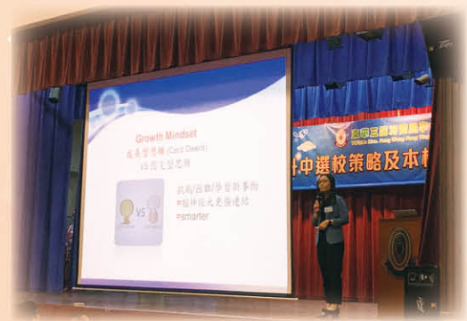
本校兩位副校長分別向區內家長解說升中選校策略，以及本校教學方式，家長反應熱烈，並踴躍發問

在升中講座當日，本校更開放多個課堂讓區內小學生體驗中學上課生活，並讓本校學生有機會與他們分享中學生活心得。