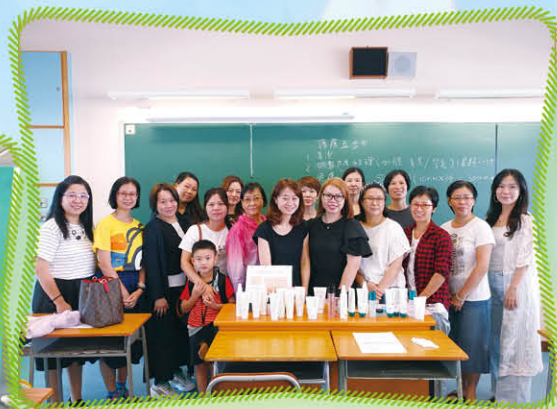
家長教師會美容班