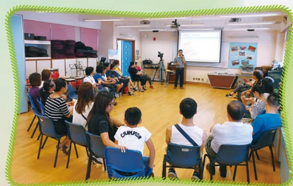
適教 GO 中生