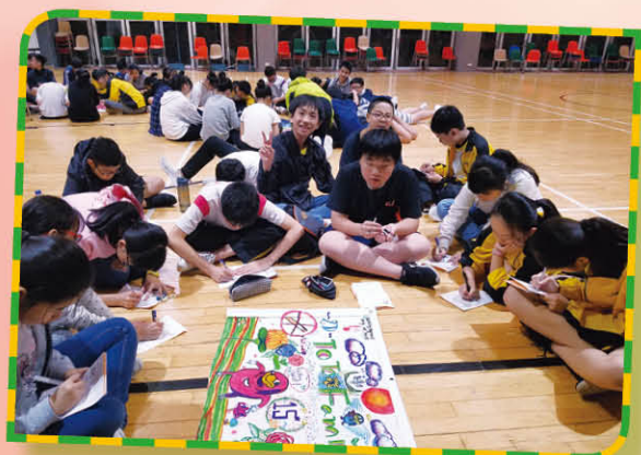
活動後反思自身所得