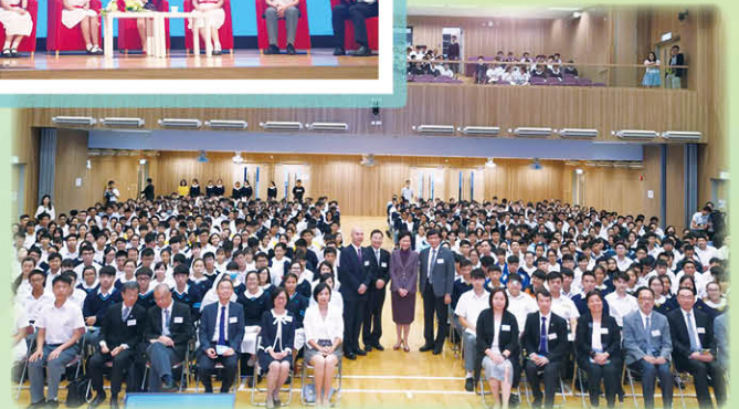
特首與參與師生大合照