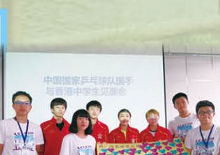
與中國國家隊乒乓球員合照