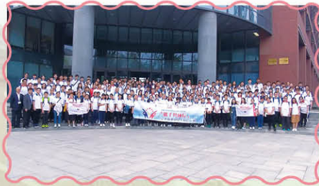
清華大學演講廳前合照

在參觀清華大學的過程中，得知那兒的面積有三百多萬的平方米，在前往食堂的過程中，我們可以看到沿途的建築物，都有不同的學系科目，例如電子工程學等。並於清華大學生的領導下，還去了清華園，在遊覽完清華園中「水木清華」的優美景色後，我們便去了清華大學校史館瞭解當中的史蹟。