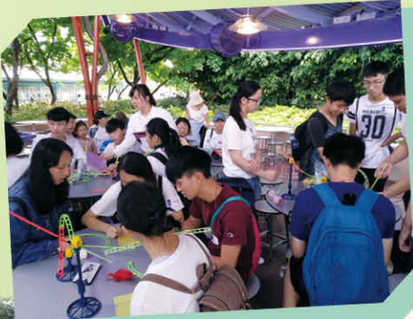
自行製作夢想中的過山車