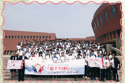
清華大學歷史檔案館合照