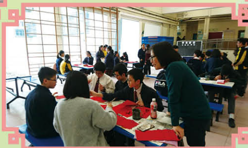
老師指導學生寫揮春