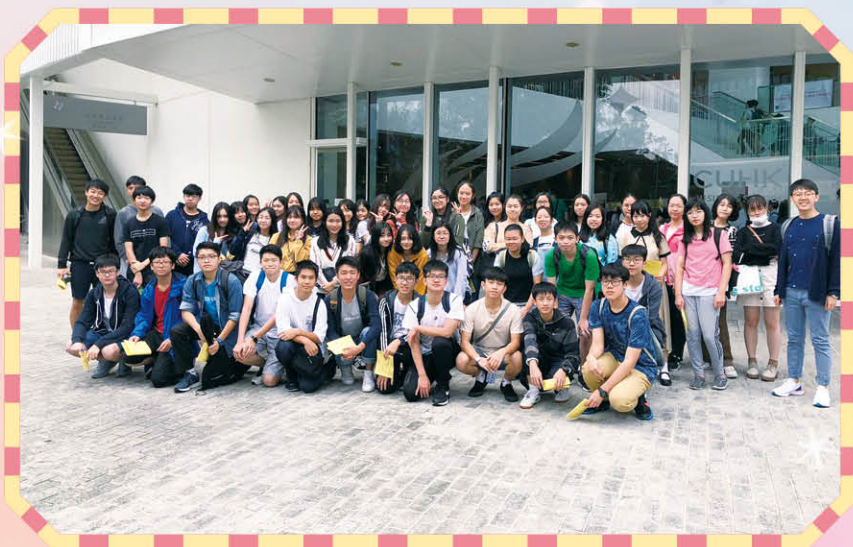
出席香港中文大學資訊日