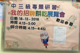
舉行展覽會展示同學作品