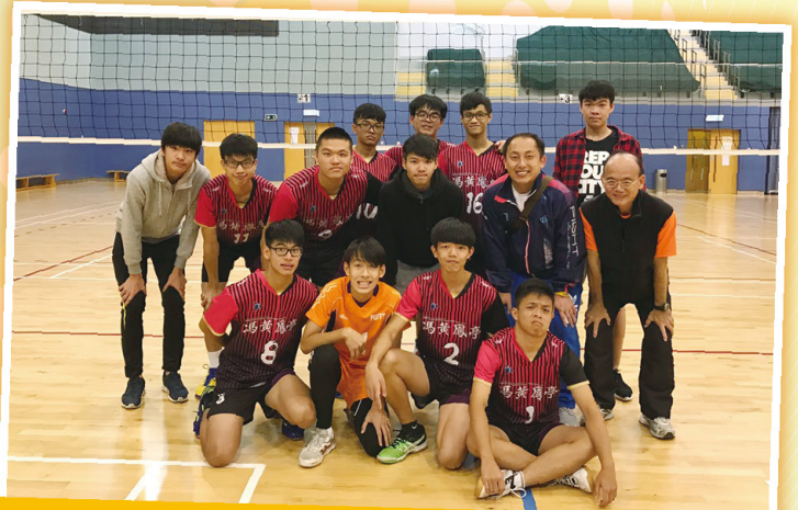
沙田及西貢區中學男子排球比賽 (第二組) 第五名