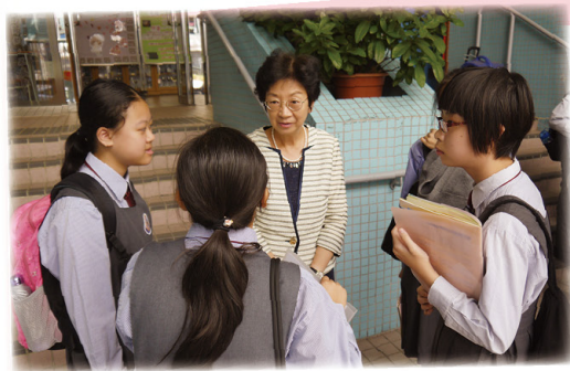
與校長分享課堂心得