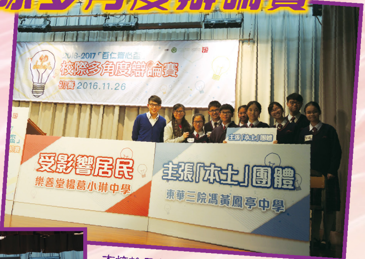
本校於是次比賽飾演「主張『本土』團體」，與另外兩所中學的同學一較高下。