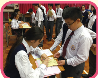
LAC activity 跨學科英語活動