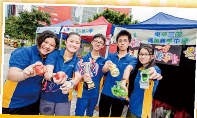
中電新力量青年領袖發展計劃優異獎