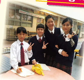
S1 interviewing S5 中一訪問中五