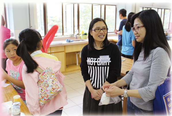
家長與老師交流心得