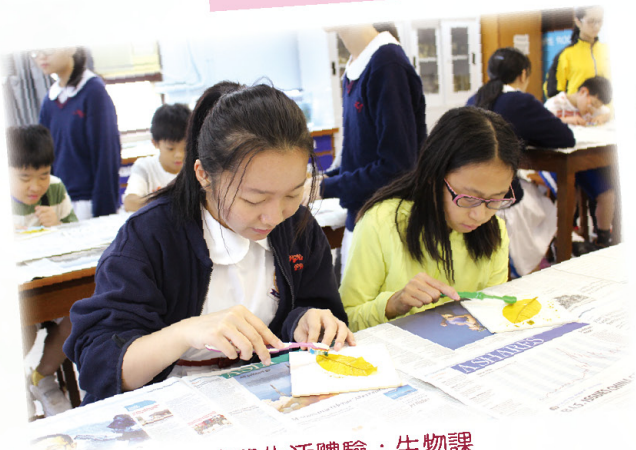
中學生活體驗：生物課