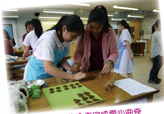
兩地學生合作完成愛心曲奇