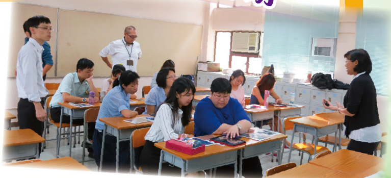
中文科老師互相交流

透過教育局資訊科技教育卓越中心，我校邀請了樂善堂余近卿中學、孔教學院大成何郭佩珍中學及崇真書院的十多位老師到校就推行電子學習的教學法、技術及管理作經驗分享。講者按不同的教育領域（中、英、數理及人文學科）分組進行電子學習工具的使用示範，並分享他們實踐所得，及具成效的寶貴經驗和成功策略，當中不乏具啟發性的觀點，有助促進本校電子教學的發展。