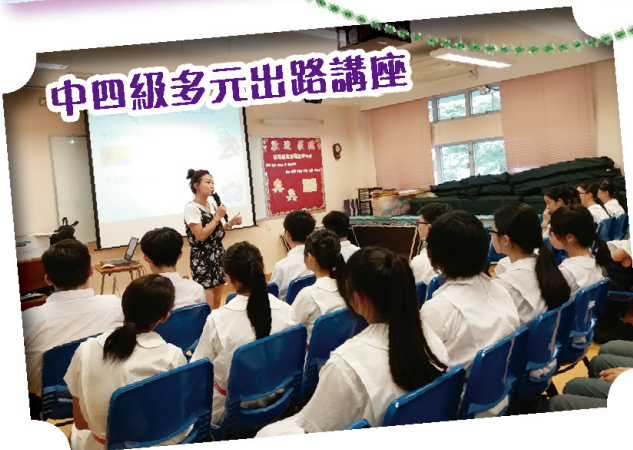
中四級多元出路講座