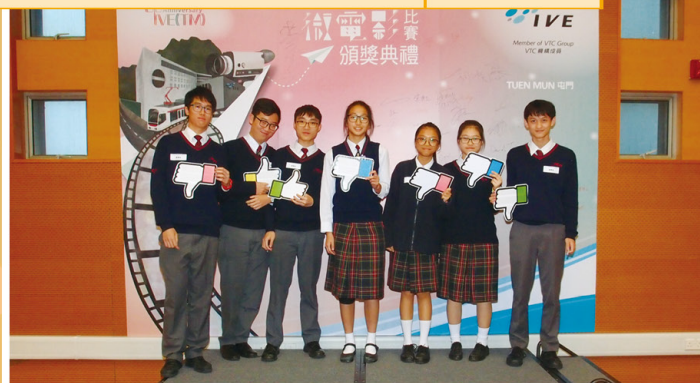
香港專業教育學院(屯門)三十週年微電影比賽優異獎