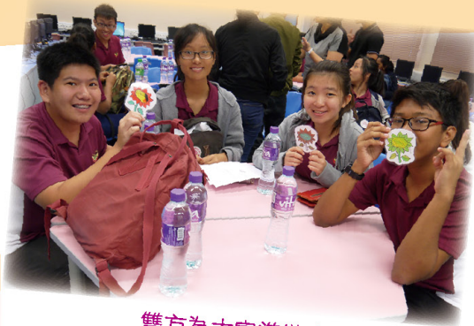
雙方為大家準備小禮物