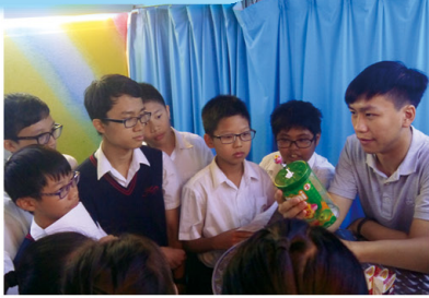
健康及禁毒資訊展覽