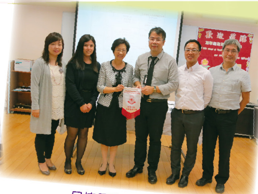
呂校長致送紀念品