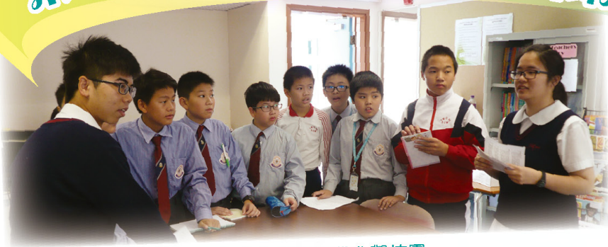
學生大使帶領同學參觀校園