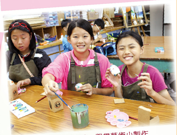
中學生活體驗：視覺藝術小製作