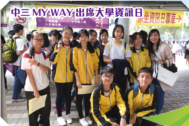
中三MYWAY出席大學資訊日