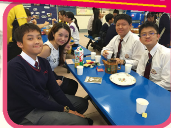
Tea Culture Activity 中英茶文化對對碰