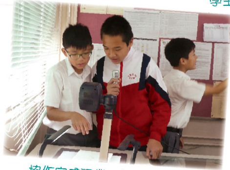
協作完成課業，並一同匯報