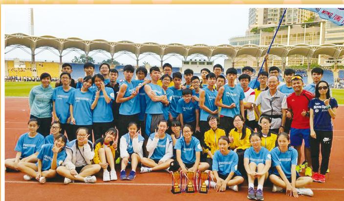
東華三院中學聯校運動會獲佳績