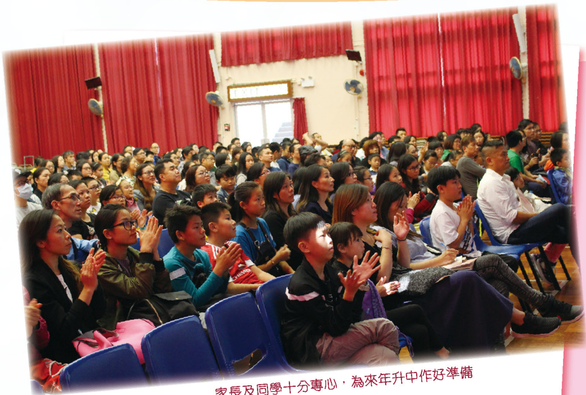
家長及同學十分專心，為來年升中作好準備