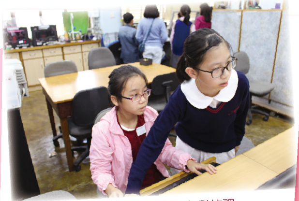
中學生活體驗：設計與科技課