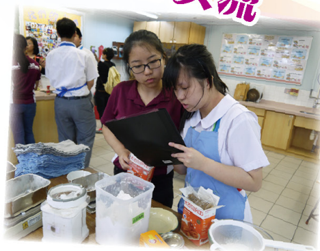
互相交流廚藝心得