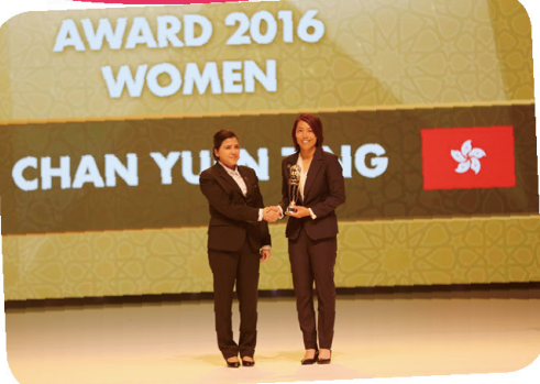
陳婉婷當選亞洲足協年度最佳女教練