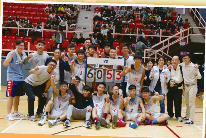
沙田及西貢區中學男子甲乙組籃球比賽 (第二組) 冠軍