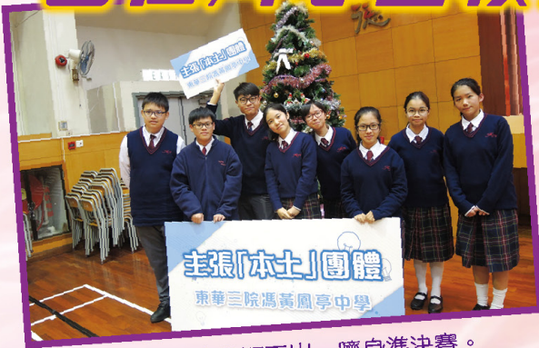
本校於 32 所學校脫穎而出，躋身準決賽。