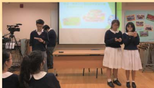
義工同學於周會分享計劃的宗旨和成果，希望感染更多人積極貢獻社群