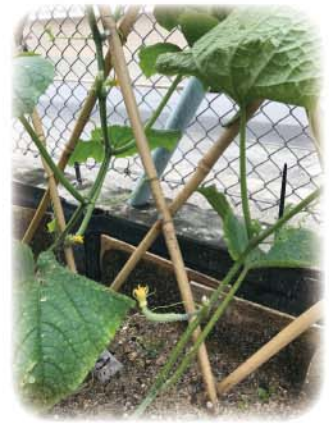
翠玉瓜果肉鮮嫩，入口清甜，營養比一般瓜類豐富