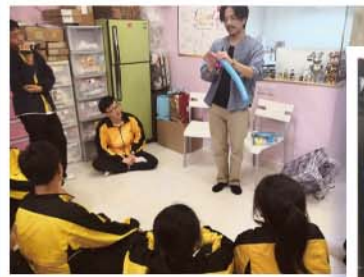
S.4 Balloon Artist