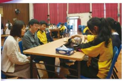
學生用心泡茶，以感謝師恩