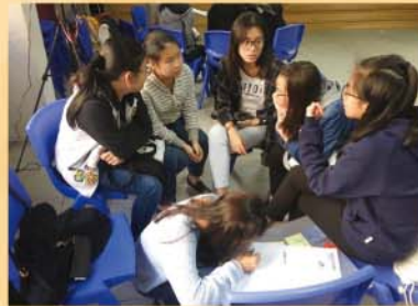
同學在構思「點子」後，也討論「點子」的可行性及限制