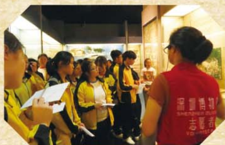
同學細心聆聽講解

深圳博物館內珍藏了許多民國時期的展物，如有國務院文件，更有許多關於當時情景的雕像等，讓我們驚嘆不已。館內提供的資訊讓我們這一代年輕人認識更多歷史事件，從歷史中學習。