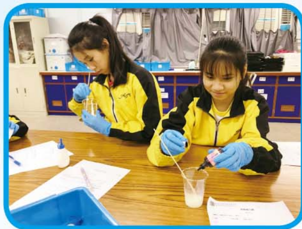
做個彈彈波 — 學生透過製作彈彈波理解製作聚合物的化學原理