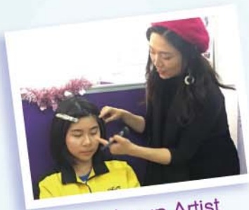
S.4 Make-up Artist

The S.5 project required our students to go through the experience from creating and using their own curriculum vitae to applying the relevant information to attend a simulated job interview. We hope that such experiences would better equip them for future challenges in their career orientation.