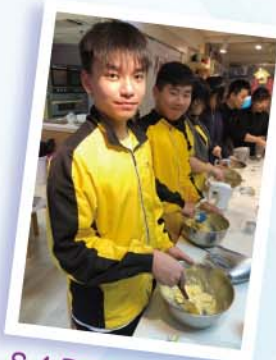
S.4 Pastry Chef