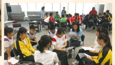
在教育局參加培訓工作坊