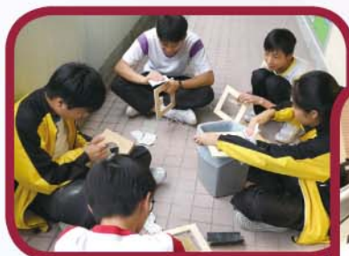
中二級同學自製 PM2.5 空氣清新機