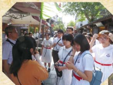
同學遊歷清河坊古街