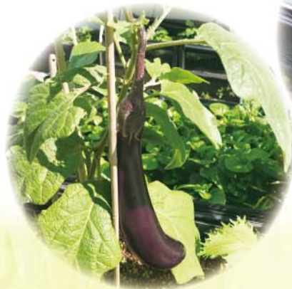
茄子的紫色外皮含有大量花青素