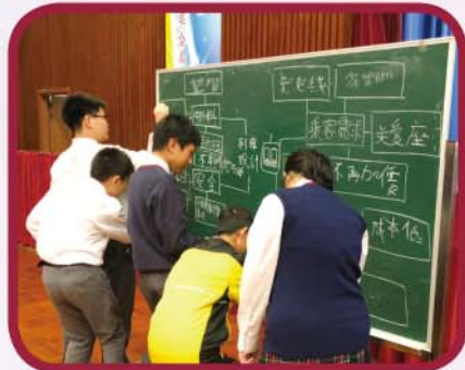
同學積極回答問題