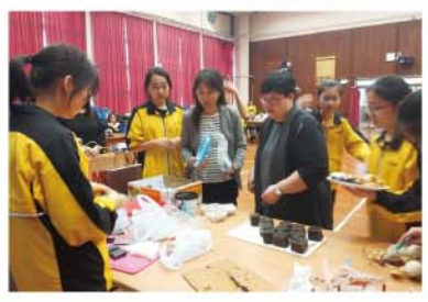
師生積極籌備「敬師愛生茶聚活動」