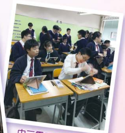
中二電子學習活動