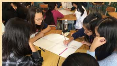
同學正構思創新的點子協助服務對象改善生活