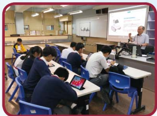
Codey Rocky 編程課程