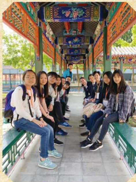
海澱區教師進修學校 附屬實驗學校內觀