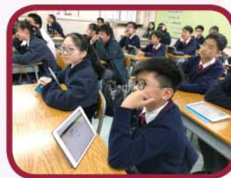
實行電子教學， 以 iPad 上課