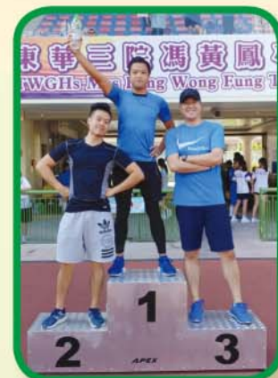
1819 周年 運動會邀請賽