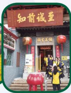
學生參觀侯王廟，了 解其演變歷程及功用