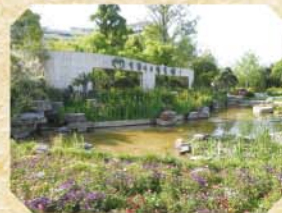
中國竹子博覽園外觀

過了一會，我們邁進校園，杭州四中的同學一邊帶領我們參觀校園，一邊與我交流，分享兩地生活的不同。學校周圍瀟灑學習的氣息，隨處可見一些名人的詩句和勉勵學生的警語。當我們走過教學樓時，看見課室裡的學生孜孜不倦地埋頭鑽研。當時我就問了一個問題：「你們為什麼這麼熱愛讀書？」同學聽了以後若有思索地道：「上大學是我們的夢想，書中自有黃金屋，遨遊書中世界不僅僅可以吸取新知識，還可以開闊眼界！」我明白了夢想其實並非遙不可及的事情，只要通過實踐，盡己所能，努力爭取，必有所獲，我堅信「一分耕耘，一分收穫」的道理。