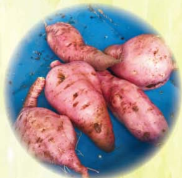
有機農耕收成的黃心蕃薯會送到安老院