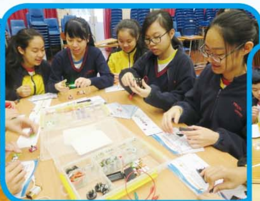
動手體驗閣 — 學生積極參與活動，從中學學習科學理論