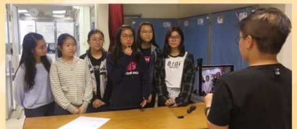
「聰明豆」拍攝短片介紹她們構思的「點子」