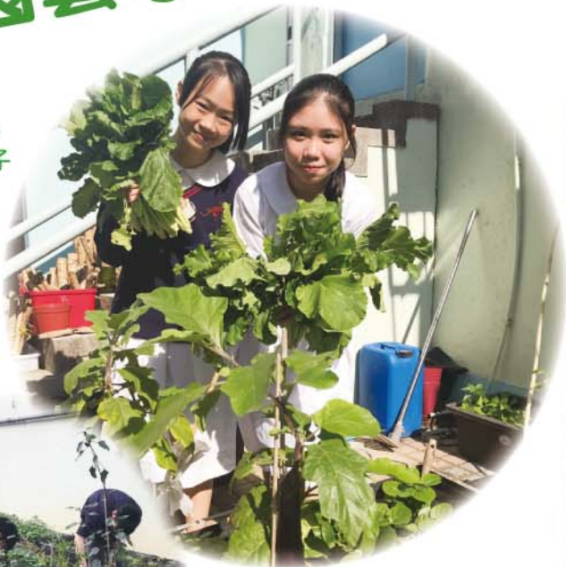
我們的收成 - 大芥菜和茄子