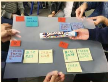
參與活動的同學組別名稱為「聰明豆」