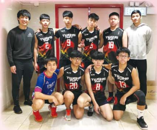
排球隊於沙田及西貢區中學甲組校際排球賽 (第二組) 獲季軍