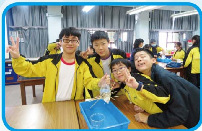
變「形」的科學 — 理解聚合物的特性

透過一系列生動有趣的實驗活動，引起學生對科學的好奇心並在愉快學習的過程中了解背後的科學原理。