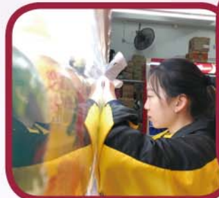
同學認真尋找解答 數學遊蹤的答案