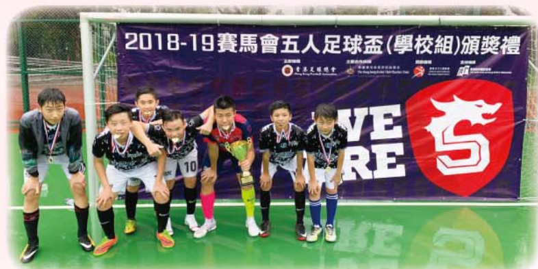
足球隊於賽馬會五人足球盃 (學校組) 獲得亞軍