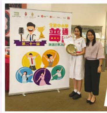
第二十一屆全港中小學普通話演講比賽 2019 獲獎