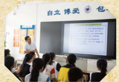
兩校師生在中澳實驗學校上課

首先，我們兩校的師生在友校的教學樓前拍照留念，友校同學十分熱情地向我們介紹他們的校舍，並帶領我們參觀校園。一路上，我們互相分享各自學校的特點，也讓我們了解到不同地區的教育制度。