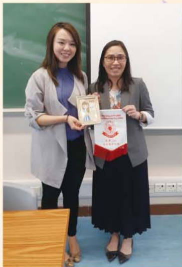
法醫人類學家講座