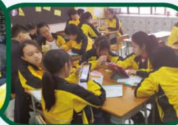
學生分組整理實地考察資 料，並製作專題研習報告