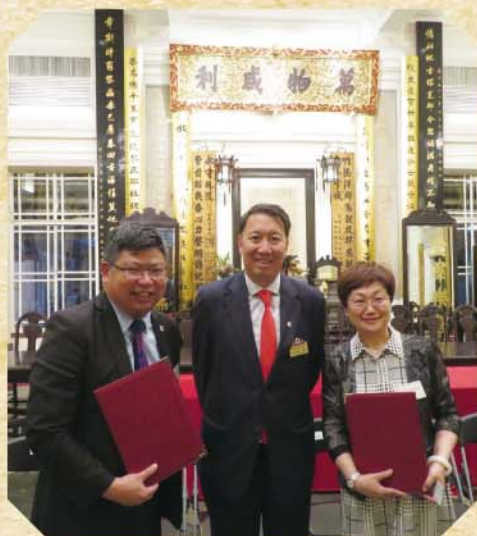
兩校校長與馮敬安總理合影

華東理工大學附屬中學確立了「內修外行，多元發展；相容並蓄，理工見長」的辦學目標，這跟本校重視學生學術跟品德教育並行，鼓勵同學發展多元潛能，重視「全人教育」理念契合。期盼在未來的日子，兩校可以有不同層面的接觸，這既加強滬港兩地教師的學術交流，又為學生提供拓寬視野的平台，更增進兩地的情誼。