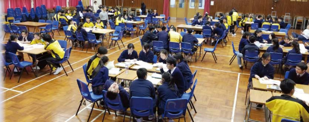
高中選科學長分享活動