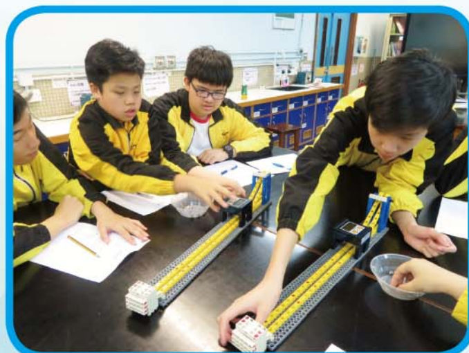
挑戰角 — 學生從實驗中學習能量轉換和能量守恆定律，設計一個最高速的高斯磁力炮