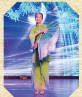
友校同學表演中國舞《詠荷》