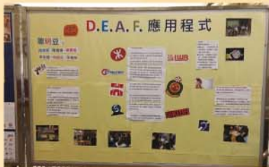
將參與「感創敢為」的經驗與全校同學分享