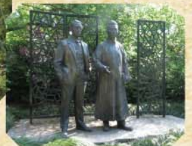
徐志摩、郁達夫銅像