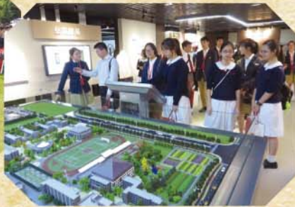
同學參觀杭州四中校史館