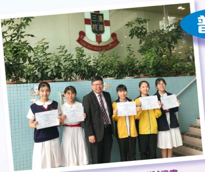
二十四位同學獲漢語口語測試證書