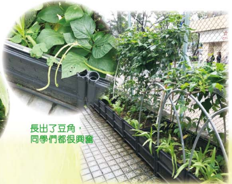
長出了豆角，同學們都很興奮