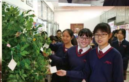
生涯規劃周許願樹活動