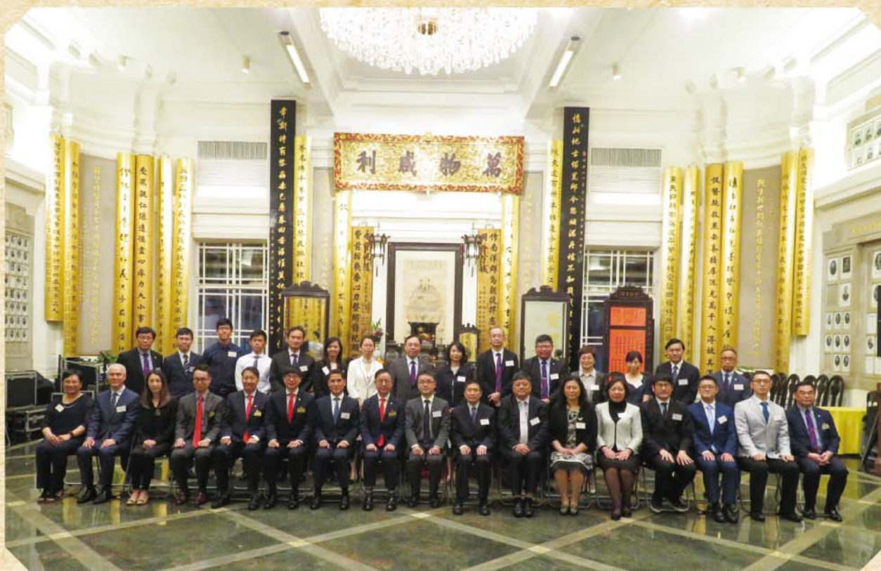
在東華三院總部禮堂合照