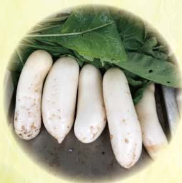
冬吃蘿蔔夏吃薑，不用醫生開藥方