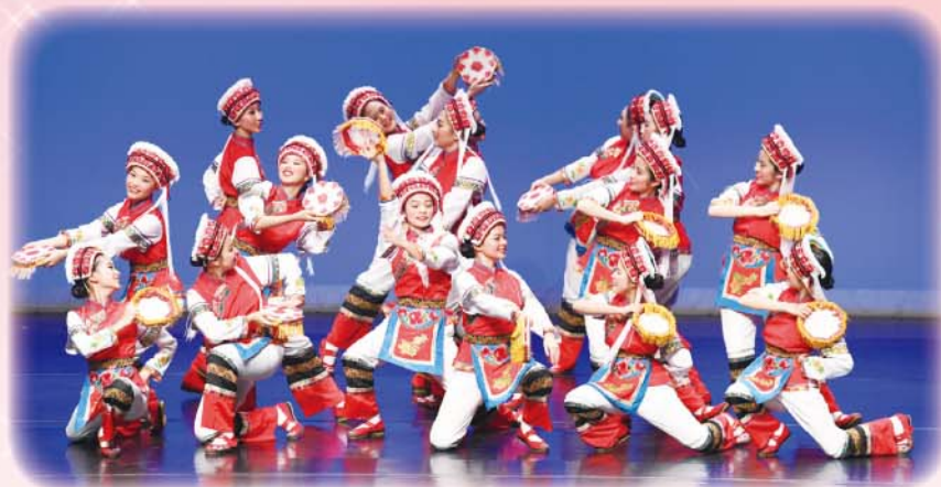
中國舞組於第五十五屆學校舞蹈節獲群舞優等獎