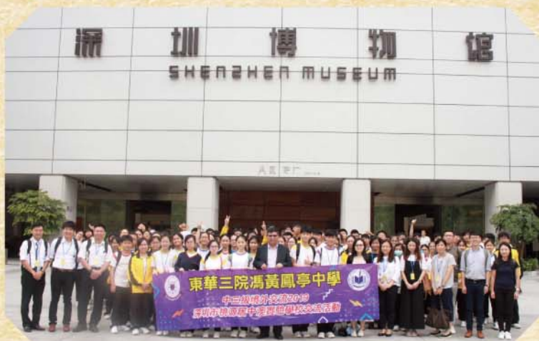
同學在深圳博物館大合照

深圳博物館的導賞員也使人印象難忘。導賞員的講解風趣幽默，把各項展品都解說得栩栩如生，加上他也會將一些生活小知識融入講解當中，讓我們更容易明白。同時也以現代和古時的生活狀況作比較，例如有一件是展現以往教學的情況，導賞員說了一些以前上學的情況，再比較現代教學的環境、教材等等，也讓我們知道現在的生活有多幸福，提醒我們要珍惜現在擁有的東西。