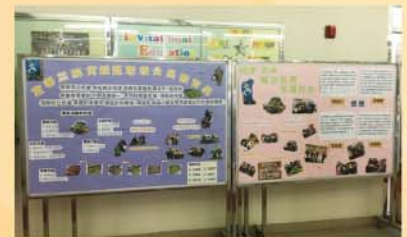
義工同學製作了展板，向同學和來賓宣揚關愛精神

參賽同學在籌劃、實踐和推廣計劃的過程中均獲益良多，以下是其中三名同學的感想，他們都希望大眾能夠多關注 SEN 兒童的需要，將關愛精神傳達到社會上其他的社群。