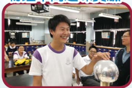
物理午間趣味實驗