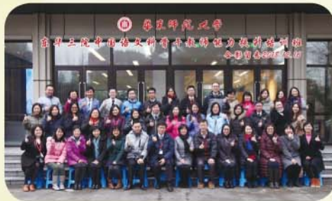
提升培訓班老師合影留念