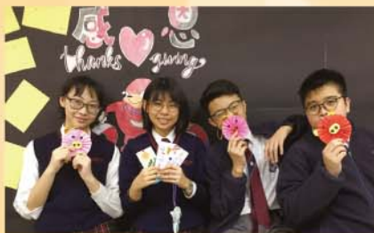
小朋友把親手製作的樹葉書籤和小手工送給義工同學，十分窩心

參賽同學在籌劃、實踐和推廣計劃的過程中均獲益良多，以下是其中三名同學的感想，他們都希望大眾能夠多關注 SEN 兒童的需要，將關愛精神傳達到社會上其他的社群。