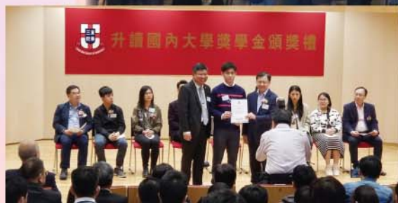
升讀國內大學獎學金頒獎禮