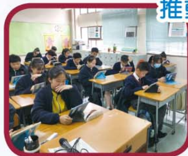
同學專心回應問題