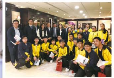
S.4 Legal Firm Visit