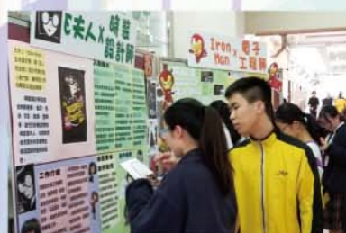
生涯規劃周有獎問答遊戲