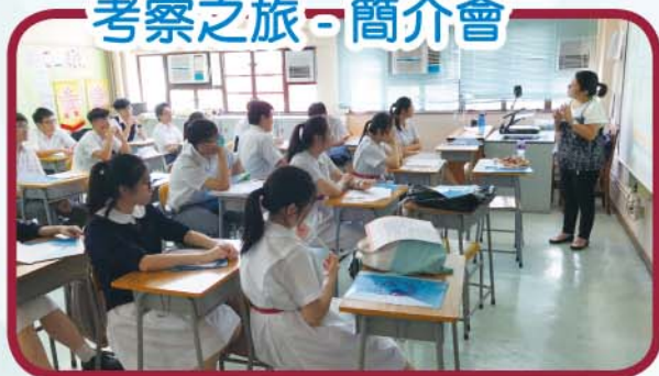
首爾五天科技及環保 考察之旅 - 簡介會