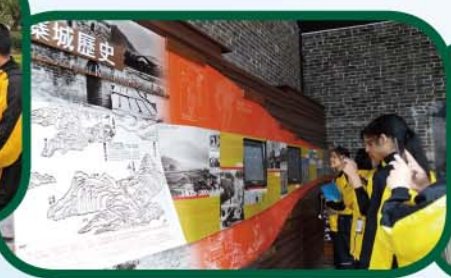
學生透過展板深入了解 九龍寨城的發展歷程