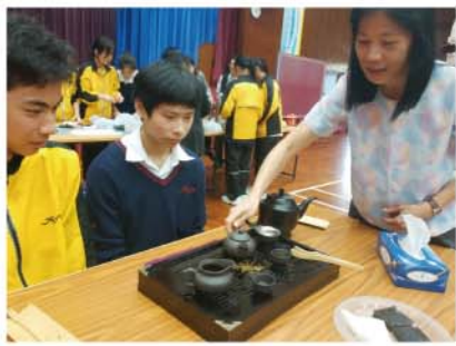
梁老師即席指導學生泡茶技巧