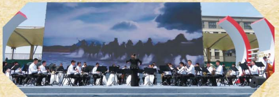
杭州四中校慶管樂團表演

今次的參觀令我十分難忘，能夠與國內學生交流，分享讀書心得，亦能從中互相勉勵。參觀杭州四中校園亦讓我拓闊視野，了解國內學校的學習模式，明白其中的與香港不同之處。在此，讓我感謝學校給予這次寶貴的機會到國內交流，也感謝校長和兩位帶隊老師的照顧。