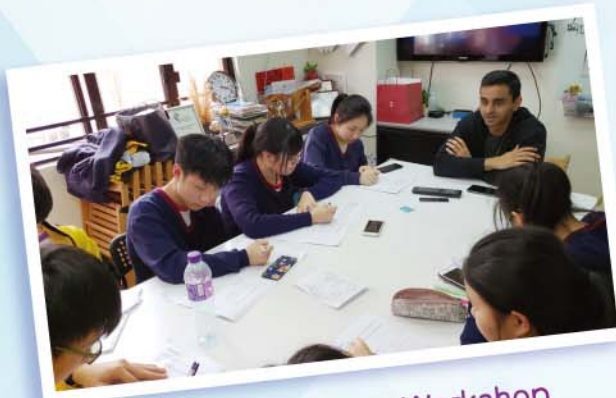
S.4 Social Career Workshop