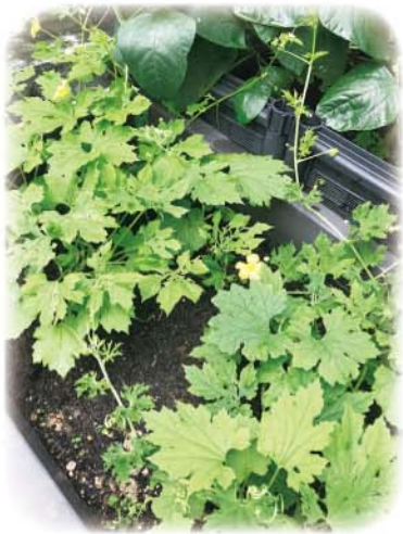
夏天人體火氣旺，吃苦瓜可以清熱去火、養顏美容