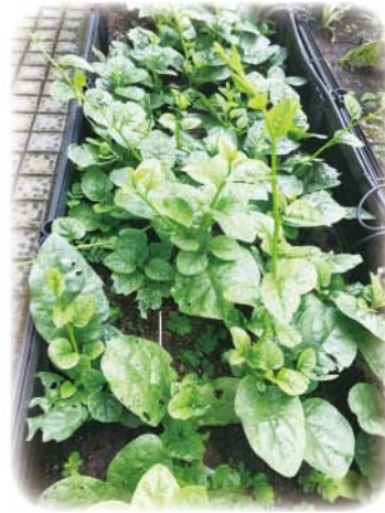
送到安老院的潺菜含大量纖維素、鐵質和纖維質