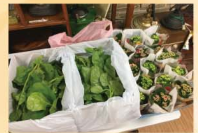
義工同學與小朋友一起探訪安老院，並把有機蔬菜和小盆栽送贈給長者