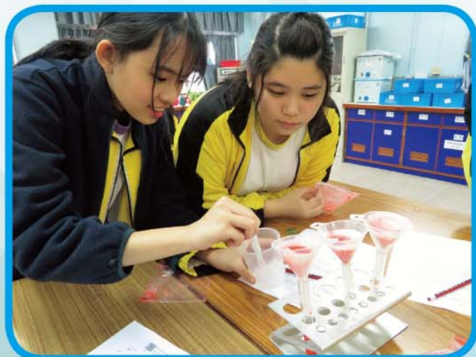
生命密碼 — 學生從提取草莓 DNA 的實驗中認識遺傳密碼