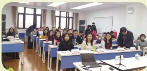
在華東師範大學上課