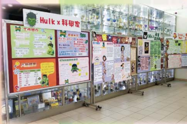
超級英雄和他們的職業展板