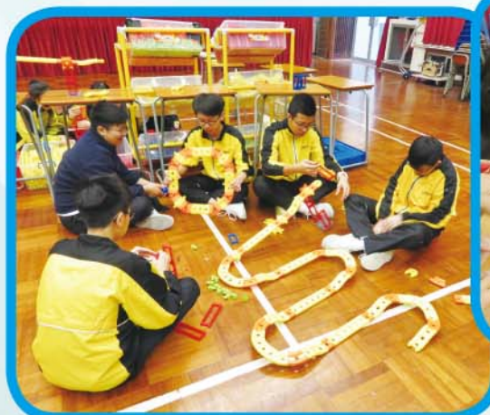
動手體驗閣 — 挑選適合的部件，動手設計過山車軌道