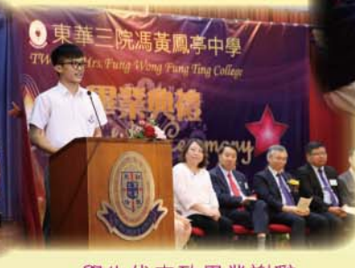
學生代表致畢業謝辭

小記者：現在香港學生的學習壓力頗大，相信你一直修讀至博士學位，求學之路應該也不容易，請問當中你有沒有遇到過一些令你沮喪的事？請問你又是如何堅持下去？