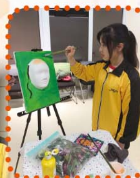
香港家庭遊戲學會