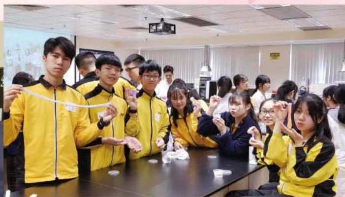
參觀沙田專業教育學院