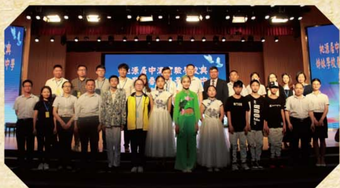
兩校教職員及表演同學合影

在這次的交流中，令我最難忘的正是內地同學帶來的表演。當地同學的表演令我大開眼界，因為四人一起跳舞需要很好的默契，但是內地的同學既可以整齊地完成表演，更可帶動現場氣氛，深信他們一定花了不少時間排練。除此之外，姊妹校亦有一位同學表演中國舞——同學打扮成河塘裡的一朵蓮花，舞姿優雅，表現蓮花一枝獨秀的美態。另外，我覺得內地同學上課時專心致志，態度認真投入，待人親切友善，也是值得我們學習的地方。