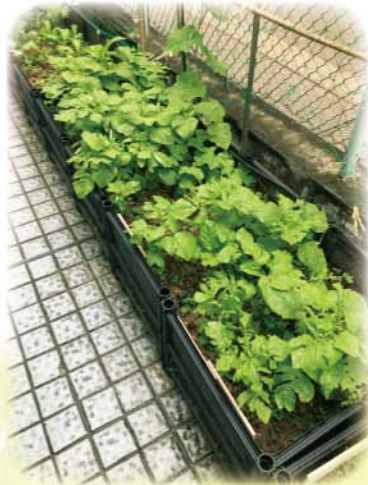
莴菜不但美味，還含有豐富的鐵、鈣，有助生長發育，也有清熱補血、增強免疫的效果