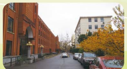
華東師範大學一隅