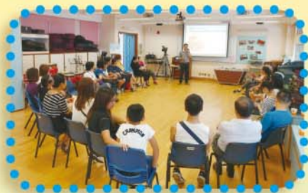
2018 適教 GO 中生