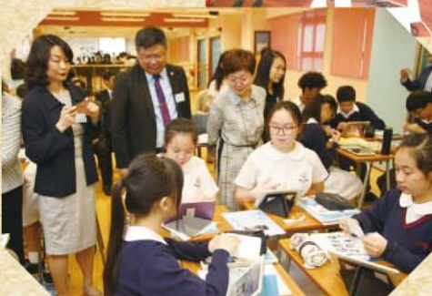
嘉賓參與本校英語課