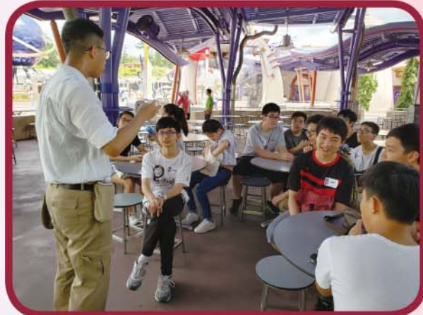
同學專心聽導師講解