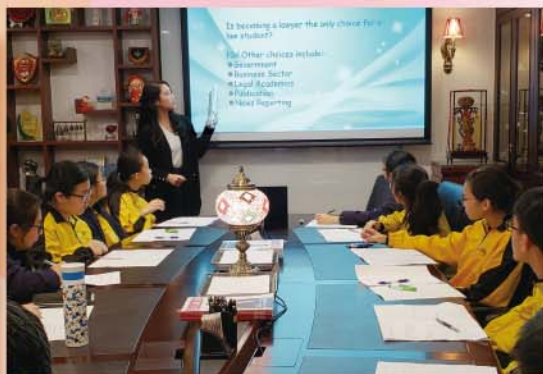
英語職業探索活動