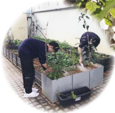
同學們在觀察泥中的蚯蚓