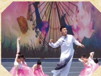
杭州四中校慶中國舞表演

隨後，我們便到運動場中的大草地參加是次校慶典禮。當天烈日當空，但亦無損我觀賞典禮的興致。典禮主持人致歡迎辭後，先是舞蹈表演，舞蹈老師更親自上場表演。當中，四中管弦樂團的表演更是扣人心弦，他們演奏了由校友金庸先生所寫的著名武俠小說改編電視劇《射雕英雄傳》的主題曲《鐵血丹心》，氣勢磅礴，其他節目也令人拍案叫絕。其後，兩校師生一同到校史館參觀，從中了解到杭州四中的歷史。