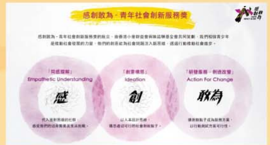
由小童群益會與陳廷驊基金會共同策劃，感創敢為 - 青年社會創新服務獎