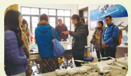
參觀市西中學學生 STEM 作品