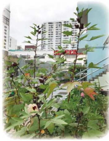
洛神花主要含有味酸，維生素C，接骨木三糖苷、檸檬酸等成分