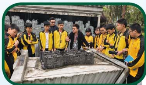
學生參觀九龍寨城公園，了解 其歷史背景、特色及重建過程