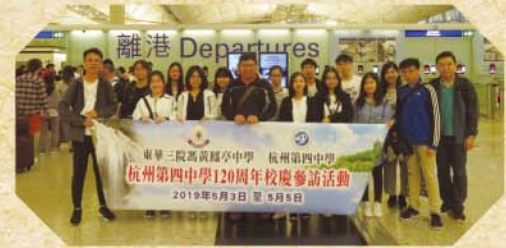
香港機場出發前合影

交流當天藍天白雲，徐徐春風，垂柳依依，如畫的景色從我剛下車就闖進我的眼簾，下車時一排學生穿著整齊的校服，臉上掛著笑容站在正門迎接我們的到來。與他們互相問好，同學問道：「剛剛坐車時休息好嗎？」，讓我們剛剛到來這裡時的陌生感頓時煙消雲散。