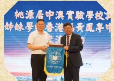
兩校校長互贈紀念品