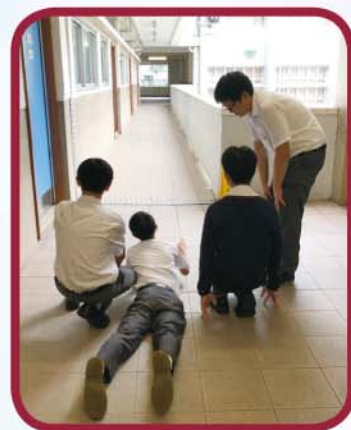
電腦科 iMovie 短片製作