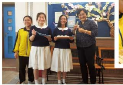
學生走遍校園，為一眾師生奉上香茗