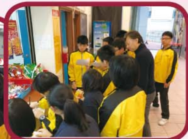
老師耐心地引導 學生思考