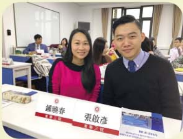
本校教師一同上課

總括而言，是次活動讓我可以有機會了解內地重點中學與著名學府在教學領域上的追求和創新，讓我有機會與其他東華三院的伙伴交流教學心得，在未來能與本校同儕多多分享。