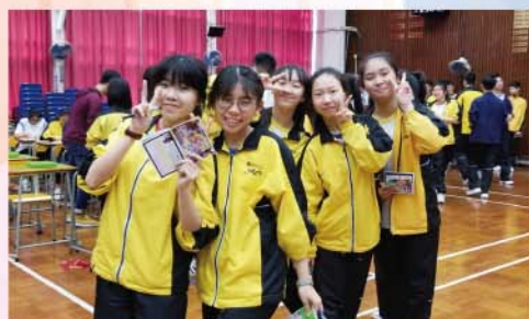
Life Channel 模擬人生活動