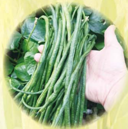
豆角的營養素相當豐富