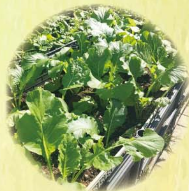
芥菜在陽光照耀下，是鮮綠的色彩，真是美極了！