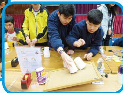
動手體驗閣 — 學習重心轉換之原理，製作可跑斜路的機械人