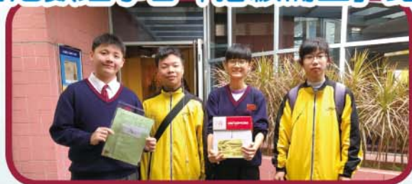
香港數理學會「拾級而上」比賽