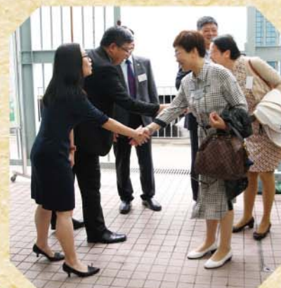
上海徐匯區嘉賓光臨我校