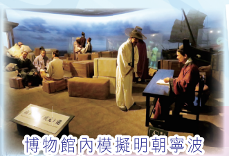
博物館內模擬明朝寧波商港一貌