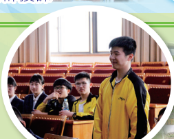
我校同學在社模聯活動中積極發表意見

此外，模聯社的活動亦使我們獲益良多。是次活動的主題是烏克蘭問題。雖然在活動開始時，我校同學對於新穎的模聯社活動並不熟悉，但是在同組的四中同學帶領下，我們也能盡快投入活動之中。過程中同學們熱烈討論，積極發言。會議最終以烏克蘭政府與民間政府訂立和平協議劃上完美的句號。我們認為這次活動別具意義，透過聯合國會議多邊議事的方式，使我們能從不同立場分析國際問題，尋求解決方案，開闊了我們的國際視野，並訓練了我們的表達、分析能力。