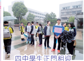
四中學生正門相迎