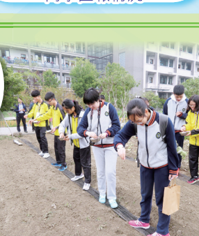
兩校學生在種植園撒下種子