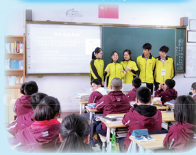
四中學生成認真上課