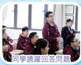
同學踴躍回答問題