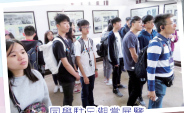
同學駐足觀賞展覽