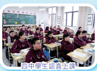
四中學生成認真上課