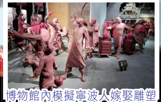
博物館內模擬寧波人嫁娶雕塑