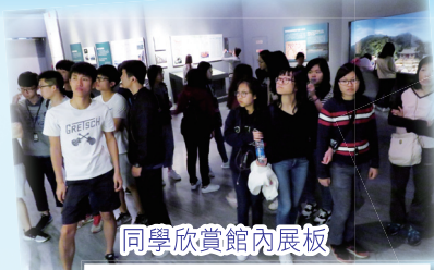
同學欣賞館內展板