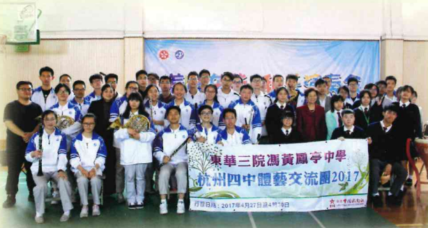
杭州四中管樂團與本校中樂團在「養正東華和樂演奏會」後