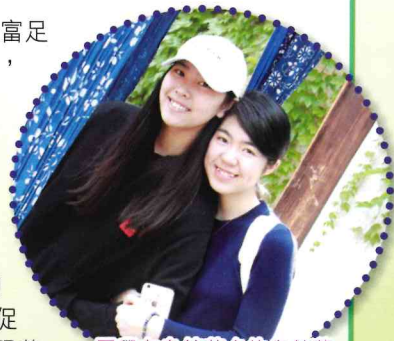
同學在烏鎮著名的烏鎮藍印花布前留影