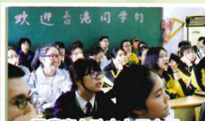
同學專心致志上歷史課