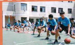
我們在杭州四中止體育課