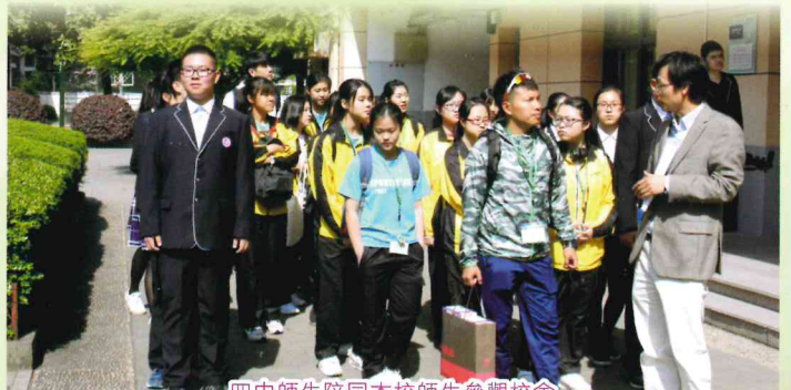
四中師生陪同本校師生參觀校舍