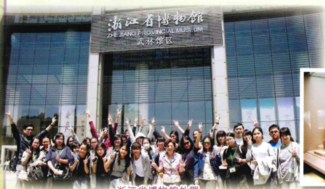
浙江省博物館外觀

浙江省博物館裡的展品多不勝數，琳瑯滿目，在這短短的篇幅中未能盡錄，其實館內更展示了一些大家耳熟能詳的文物，包括金釵、爵杯等，令人目不暇給，若有機會的話，希望可以帶大家一起到浙江省博物館參觀，一睹這些文物的風采。