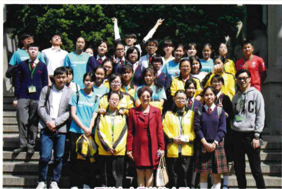
團隊在中國美院合影

是次旅程不但使我跳出校園，了解杭州這個歷史都城的風光面貌，更充分感受杭州的人傑地靈。我期望下次能再到訪杭州四中，與四中同學再次相見，向他們好好學習，見賢思齊，以不負這難得的交流機會。