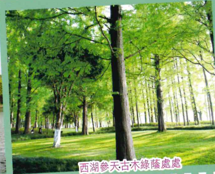
西湖參天古木綠蔭處處