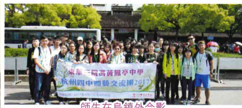
師生在烏鎮外合影