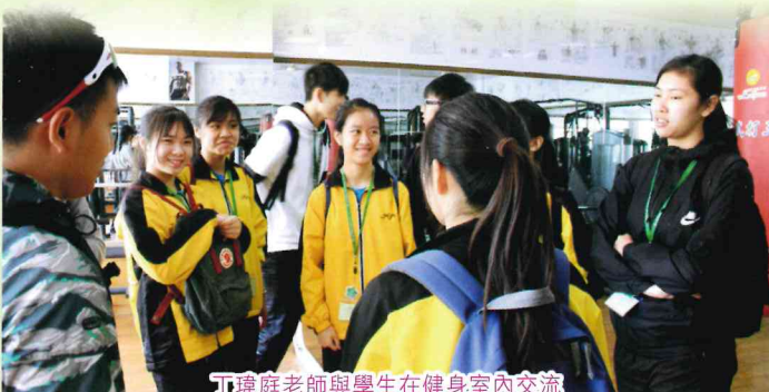
丁璋庭老師與學生在健身室內交流