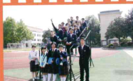
兩校師生在運動場上合影