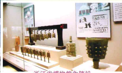
浙江省博物館內陳設