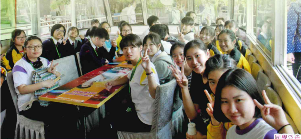
同學泛舟湖上自拍