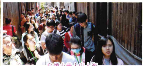
烏鎮小巷人山人海