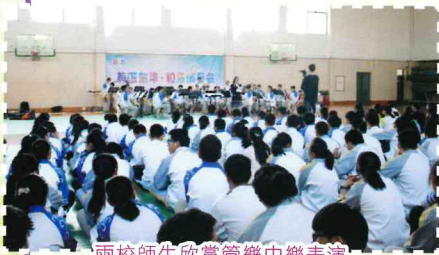
兩校師生欣賞管樂中樂表演

通過這次的交流，我們都得益不少，同時也了解到杭州四中的管樂團團員對音樂的熱情。從他們的神態，更可體會他們對音樂的那份執著和認真。在欣賞他們的演出時，以及在我校中樂團表演時，我們均不斷反思自己的不足之處。相信通過是次交流，大家的眼界都有所擴闊，互取各自的長處，補己之短；最重要的更是讓我們知道，無論做任何事情，我們只要做好充分的準備，對自己抱有信心，相信自己，盡力做好，一定會成功的。