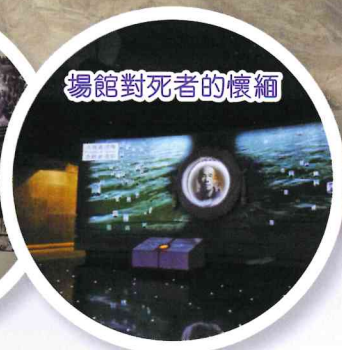
場館對死者的懷緬

紀念品收集的、輯錄的資料除了有中國人的紀錄外，更有不少是來自日本、美國，以至其他海外媒體的新聞報導，這更加反映此次事件的真實和可信。紀念館保存了大量曾參與南京大屠殺的日本老兵對此次屠殺的口述及文字紀錄、他們的道歉、懺悔，甚至譴責日軍暴行的資料。