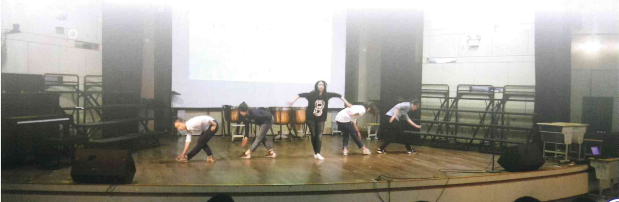
杭四同學精彩獻藝