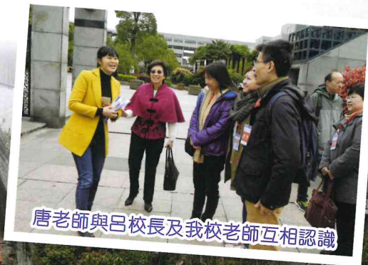
唐老師與呂校長及我校老師互相認識