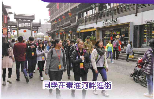
同學在秦淮河畔逛街