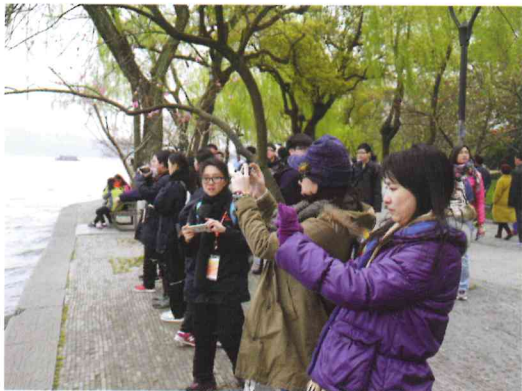
本校師生在西湖畔攝影