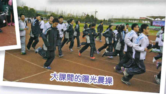
大課間的陽光晨操