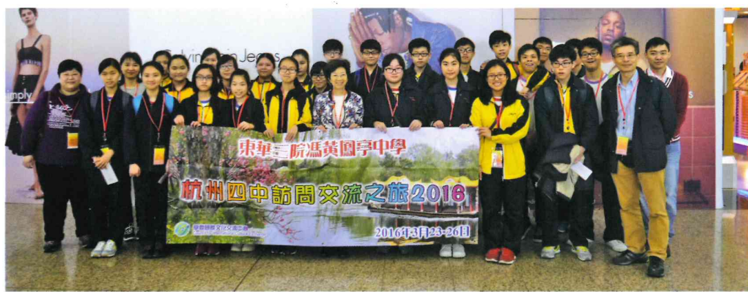
出發前香港機場留影