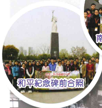
和平紀念碑前合照