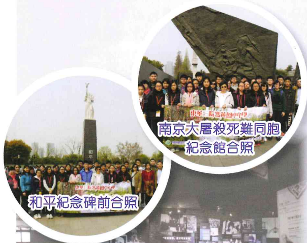
南京大屠殺死難同胞 紀念館合照

南京大屠殺已成歷史，不論說辭如何，也不是犯下這天理不容的歷史罪行的原因。但願中國人以史為鑑、世界上每個民族也以此人道罪行為鑑，堅守和平，不容許軍國主義、納粹主義再復辟，更不容許百姓生活在惶恐下。但願這紀念館將是世界上，最後一座紀念人道罪行的紀念館，但願！