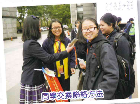
同學交換聯絡方法

離別的一刻，看見杭州四中的師生在大門揮手送別，心中忽然想起「有緣千里來相會」的詩句，我深信我們和杭州四中是有緣人，日後自會有更多相聚的機會。我懷著這份盼念，向杭州四中揮別，並期待日後重聚的時光。