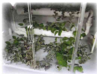
生物實驗室培植的植物

我們有幸可以看見全級學生在運動場跑步，原來那是每天也要進行的指定動作，稱為陽光晨跑。看見他們努力地跑，讓我們也有衝出去跑步的念頭，同時更覺得能在這間校園上課，真是幸福。