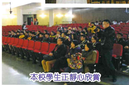
本校學生正靜心欣賞