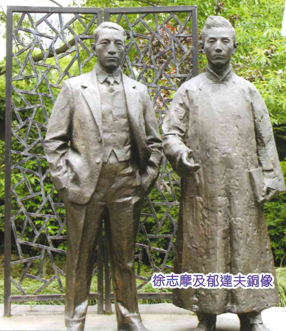
徐志摩及郁達夫銅像