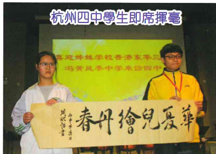
杭州四中學生即席揮毫

這次才藝表演使我印象難忘，實令我有意猶未盡之感，真盼望兩校能增加互訪，讓我們有更多機會認識兩校學生的不同才藝。